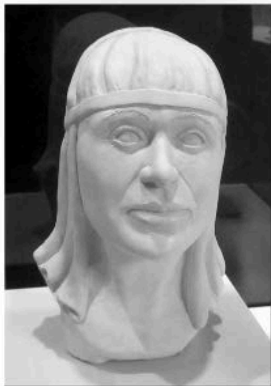
Sophias rekonstruerede hoved. Nationalmuseet.

Dette er mit forsøg på at hægte kød og blod på de meget få fakta, der findes om Sophia, samt på de øvrige fakta, vi har fra hendes tid; fakta, som naturligvis har været bestemmende for Sophias liv.